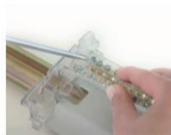
Sistema de liberación de barra