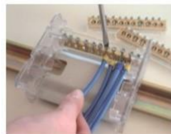
Cableado por cada barra