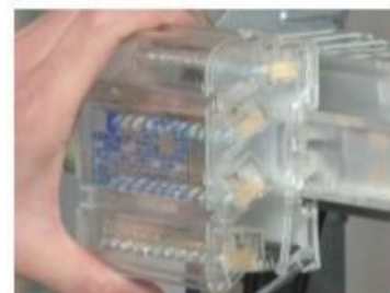
Acoplamiento en carril DIN